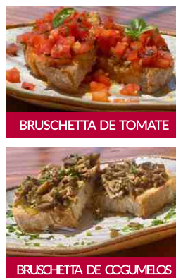
BRUSCHETTA DE TOMATE