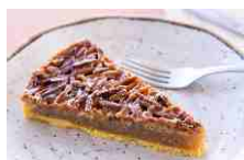
TARTE DE AMÊNDOA