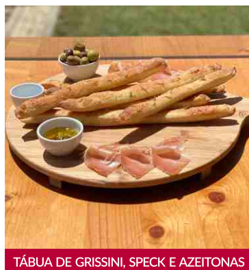
TÁBUA DE GRISSINI, SPECK E AZEITONAS

NENHUM PRATO, PRODUTO ALIMENTAR OU BEBIDA, INCLUINDO O COUVERT, PODE SER COBRADO SE NÃO FOR SOLICITADO PELO CLIENTE OU POR ESTE FOR INUTILIZADO. DL. 10/2016 DE 16-1 NO DISH, FOOD PRODUCT OR DRINK, INCLUDING THE COUVERT, MAY BE CHARGED IF IT IS NOT REQUESTED OR USED BY THE CUSTOMER. DL. 10/2016 DE 16-1