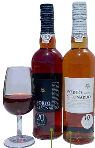
TAWNY VELHO 20 ANOS