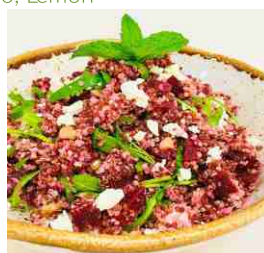
SALADA QUINOA & BETERRABA