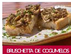
BRUSCHETTA DE COGUMELOS